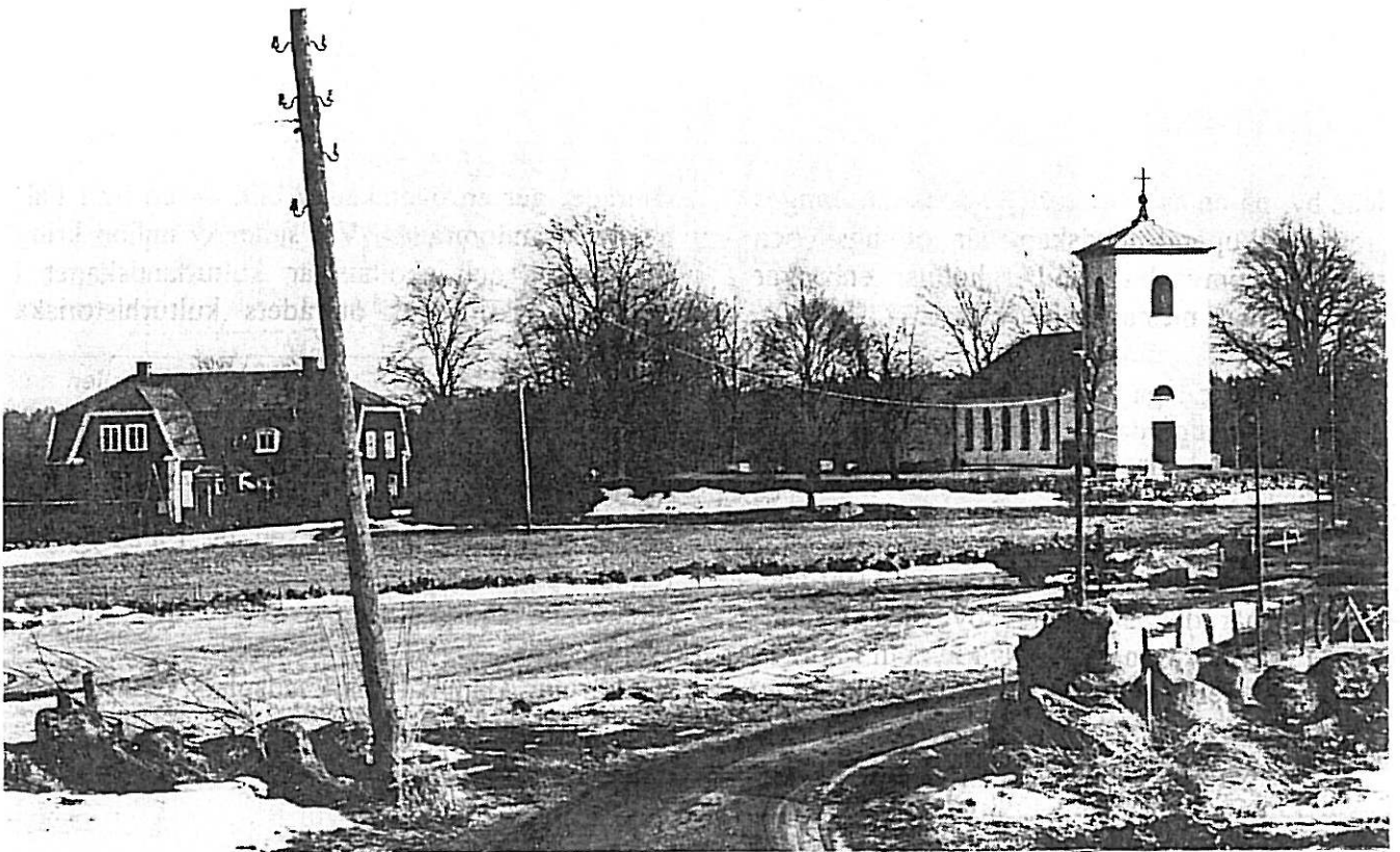
Ullene kyrka från nordväst